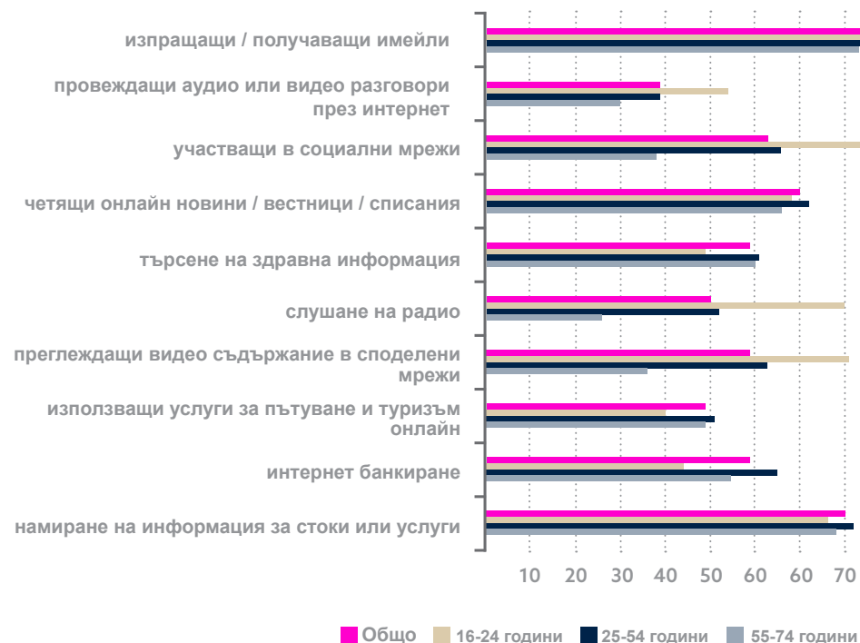
ИНТЕРНЕТ ДЕЙНОСТИ В ПОСЛЕДНИТЕ ТРИ МЕСЕЦА (%)

Последната необходимост придобива известност, тъй като фалшивите новини се отнасят пряко и влияят на общественото мнение, оттам и върху социалния диалог и политическите нагласи към теми с огромно социално значение, като бежанската криза, социалното включване на малцинствата, толерантността към многообразието, и много други.